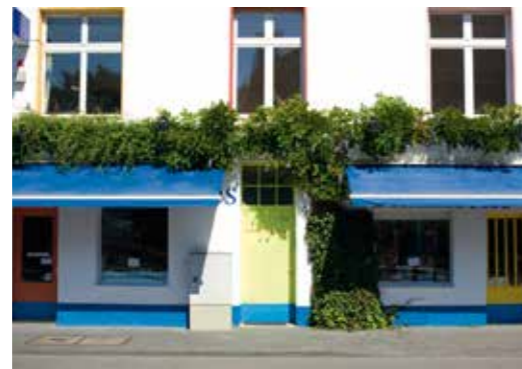
Akzentuiert und hochwertig: Herausstechen aus dem Einerlei der übrigen Häuser.