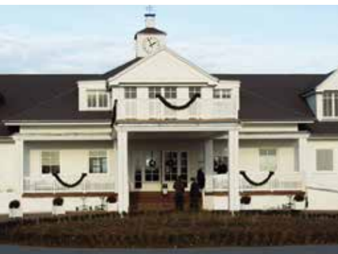
Stilsicher gestaltet: Ein exklusives Domizil.