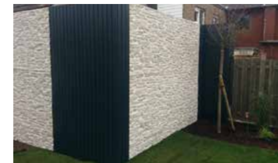
Nachher: Gekonnte Gartengestaltung.