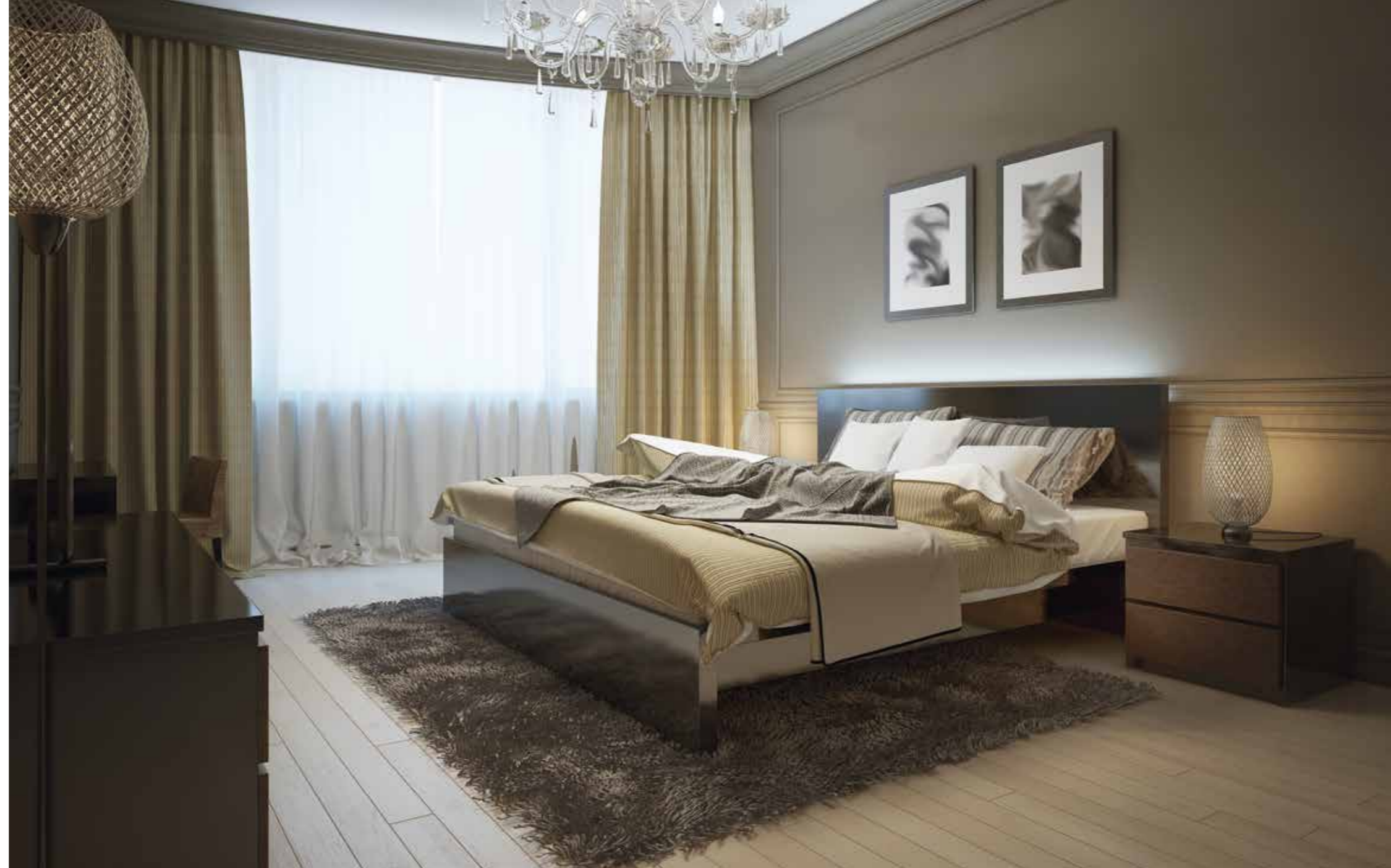
Gesamthafes Design für ein ganz besonderes Schlafzimmer.