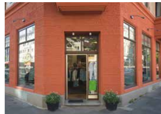
Einladend und attraktiv: Gekonnte Fassadengestaltung zieht Kunden an.

Der erste Eindruck zählt. Schon von weitem sticht eine stilsicher gestaltete Fassade heraus aus dem Einerlei der übrigen Häuser. Ob charmant, modern oder extravagant: eine hochwertige Fassadengestaltung ist Schmuck und Schutz in einem.