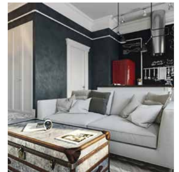
Edle Effekte im Antiklook: Ökologische Kalkfarben bilden die natürliche Basis.

Wir schaffen Wohnwelten, die nur eines sein wollen: Die passende Umgebung für Sie und ein Design-Original, was es nicht „von der Stange“ gibt.